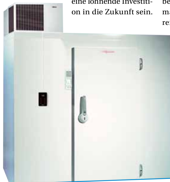
Das Deckenaggregat Tecto Refrigo (oben auf der Zelle) von Viessmann ist für Normal- und Tiefkühlung geeignet.

Hersteller von Kühlagerschränken stehen vor einer wichtigen Gesetzesänderung. Ab 1. Juli 2016 besteht für ihre Produkte, genau wie bei Haushaltskühlschränken, eine Verpflichtung zur Energieverbrauchskennzeichnung. Diese Regelung basiert auf der Delegierten Verordnung (EU) 2015/1094 der Kommission vom 5. Mai 2015. Das gedruckte Label hat eine Skala von A bis G, wobei der Buchstabe A die beste Energiebilanz anzeigt.